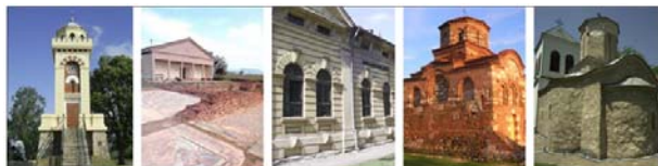
Slika 1 – Neki od amblematičnih spomenika kulture Nišavskog regiona, s leva na desno: Čegar-Niš, Medijana-Niš, Pasterov zavod-Niš, Latinska crkva-Gornji Matejevac, Crkva Sv. Stefana-Lipovac.

teritoriji Nišavskog okruga. 8 Stanje ovih objekata, kao i objekata iz ukupnog fonda nepokretnih kulturnih dobara, bez izuzetka, nije odgovarajuće s obzirom na njihov značaj. Nepotpuna istraženost objekata ili arheoloških lokaliteta, loše stanje konzervacije, neodgovarajuća prezentacija spomenika kulture i nedostatak osmišljenih kampanja njihove popularizacije karakterišu trenutno stanje graditeljske baštine u Nišavskom okrugu.