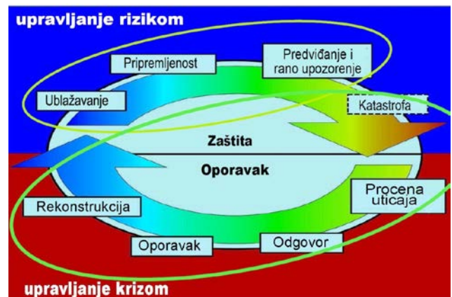
Slika 2 – Ciklusi upravljanja katastrofom

Posebna pažnja posvećena je upravljanju rizikom, odnosno predviđanju i ranom upozorenju, jačanju otpornosti i poboljšanju pripremljenosti na sušu i ublažavanju njenog uticaja.