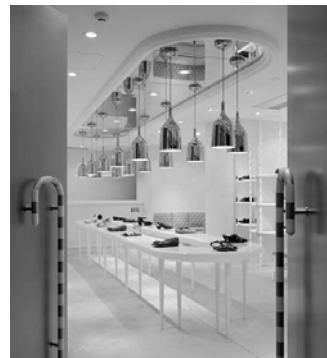
Slika 7 – Deo enterijera – pogled sa ulaza [9]