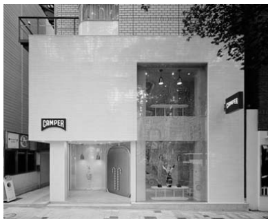
Slika 6 – Ulazna fasada objekta [9]

Oštrim ivicama i uglovima u obradi fasade i izloga suprotstavljaju se zakrivljene forme u enterijeru (sl.7), što se nagoveštava ulaznim portalom. Ceo izlog je u staklu, nasuprot punim vratima koja su otvorena kada prodavnica radi, a ulaz ostaje naglašen zakrivljenim metalnim ramom kružnog poprečnog preseka, kao granica između unutrašnjeg i spoljašnjeg prostora i uvodi posetioce u istraživanje enterijera.