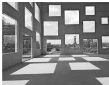
Slika 4 – Nepravilan oblik otvora na fasadama objekata [6]

Objekat Zollverein School of Management and Design u Nemačkoj (sl.4), izveden od strane arhitektonskog studija SANAA Sejima and Nishizawa iz Tokija [6] je u formi kocke, sa pravilnom geometrijom otvora, kvadratnog oblika.