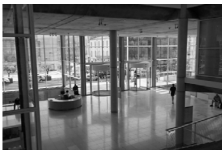
Slika 9 – Hol muzeja [10]