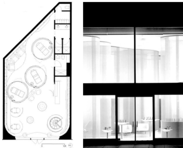
Slika 10 – Osnova kozmetičkog studija Qiora Store & Spa, Njujork, SAD [7]; Slika 11 – Ulazna fasada [7]

U enterijeru kozmetičkog brenda Shiseido Cosmetics – Qiora Store & Spa, u Njujorku (SAD), delu arhitektonskog studija Architecture Research Office [7], predstavljena je inovativna upotreba svetla i materijala. Na slici 10 je prikazana osnova objekta i funkcionalno rešenje. Ulazna fasada je cela u staklu što doprinosi prezentaciji enterijera (sl.11). Uži fasadni front, u odnosu na dubinu prostora, naglašen je vertikalnim zakrivljenim transparentnim panelima koji emituju svetlost, i raspoređeni su unutar celog salona. Preko dana, boja enterijera je bela, a noću paneli svetle u plavoj boji, i na taj način ističu objekat, njegovu dubinu i utiču na posetioce da istraže takav zagonetni unutrašnji prostor.