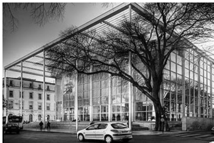
Slika 8 – Muzej primenjene umetnosti Carree d'art u Nimu, Francuska [10]