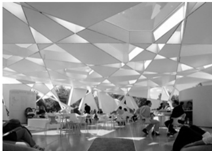
Slika 5 – Enterijer galerije [6]

mrežu u kojoj se smenjuju elementi punog i praznog. Na taj način, kroz zastakljene otvore, u objekat ulazi dnevna svetlost i stvara dinamično okruženje igrom svetlosti i senke.