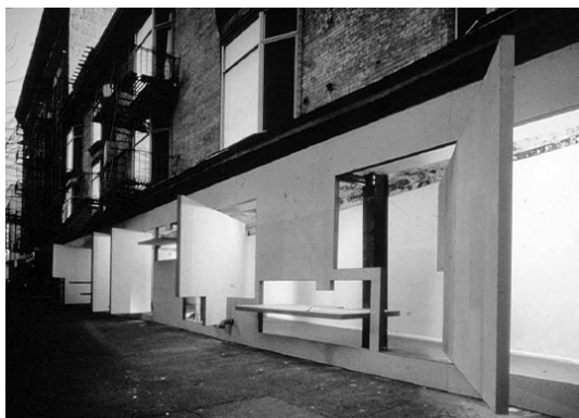
Slika 12 – Izgled objekta kada su paneli otvoreni [6]

otvaraju rotiranjem oko vertikalne ili horizontalne ose, ka ulici i unutrašnjem prostoru, i sama funkcija galerije se prenosi na objekat, i on biva „izložen” spoljašnjem okruženju. Na taj način privlači veći broj posetilaca i opravdava razlog svog postojanja. Kada su paneli u otvorenom položaju, ne može se tačno i precizno utvrditi granica odakle počinje enterijer objekta, jer su postavke izložene i na panelima koji zalaze u javni prostor. I javni prostor na ovaj način zalazi u unutrašnjost objekta, tako da granica, u ovom slučaju ne predstavlja ravan, kao kad je objekat skroz zatvoren, već zonu oko te ravni kad je objekat otvoren.