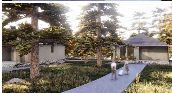
Slika 4. Idejno urbanističko rešenje i prikazi uređenja kompleksa „7 juli” - prva nagrada. Autorski tim: Jana Stanković, Boško Živković, Luka Slavić