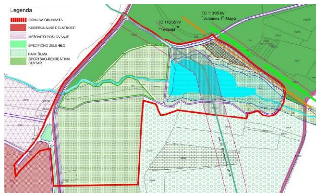
Slika 2. Izvod iz dokumenta Izmene plana generalne regulacije naseljenog mesta Paraćin

Planski osnov za izradu urbanističkog rešenja čine Izmene Plana Generalne Regulacije naseljenog mesta Paraćin (Službeni list opštine Paraćin br. 7/2018) [11] i Plan Detaljne Regulacije za lokaciju „Karađorđevo brdo“ u Paraćinu (Službeni list opštine Paraćin, br. 9/2010). Važeća planska dokumentacija definiše namenu samog prostora kao sportsko-rekreativni centar sa pratećim sadržajima. Prema Izmenama Plana Generalne Regulacije naseljenog mesta Paraćin na lokaciji kompleksa je predviđena izgradnja specijalizovanog sportsko-rekreativnog centra uz maksimalno očuvanje i korišćenje postojećih šuma (Slika 2). Plan Detaljne Regulacije za lokaciju „Karađorđevo brdo“ u Paraćinu naglašava značaj i mogućnost razvoja tranzitnog turizma zbog geografsko-saobraćajnog položaja Paraćina u čijoj finkciji na ovoj lokaciji treba realizovati aktivnosti i sadržaje za odmor i rekreaciju. Pored ovog vida turizma, predviđen je razvoj stacionarnog turizma komplementarno sa sportskim manifestacijama kao i izletničkog turizma koji je omogućen postojanjem jezera i šumom oko nje.