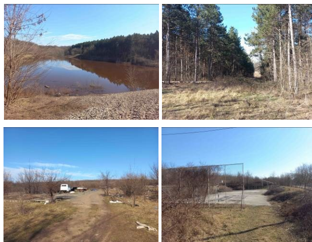
Slika 3. Prikaz postojećeg stanja kompleksa „7. juli“.

Višestruki potencijali predmetne lokacije koji se ogledaju pre svega u postojanju jezera i dominantnoj šumi postojećim uslovima nisu iskorišćeni. Trenutno je to neuređen i neatraktivan prostor sa neadekvatnim pešačkim stazama, velikim neprohodnim segmentima usled neodržavanja zelenila i potpunim odsustvom urbane opreme (Slika 3).