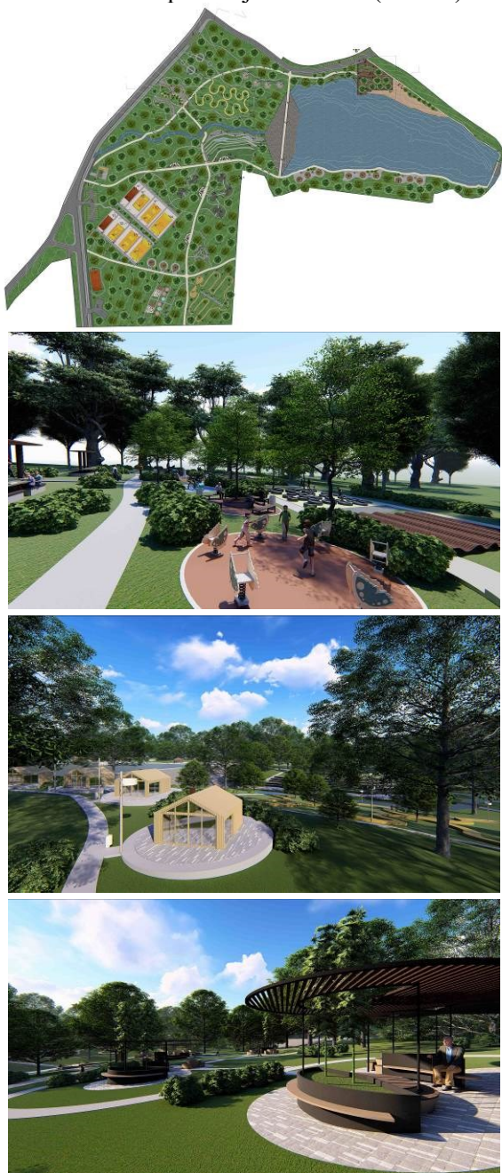
Slika 5. Idejno urbanističko rešenje i prikazi uređenja kompleksa „7 juli“- druga nagrada. Autorski tim: Predrag Ristić, Nataša Mitić, Anja Otović, Veljko Jovanović

Druga nagrada dodeljena je timu u sastavu: Predrag Ristić, Nataša Mitić, Anja Otović i Veljko Jovanović. Žiri je vrednovao ovaj rad kao veliki doprinos revitalizaciji predmetne lokacije u atraktivno rekreativno i turističko područje multinamenskog karaktera, sa raznovrsnim sadržajima za aktivnu i pasivnu rekreaciju i komercijalnim objektima, za aktivaciju priobalja jezera, od izuzetnog značaja za građane Paraćina i potencijalne turiste (Slika 5).