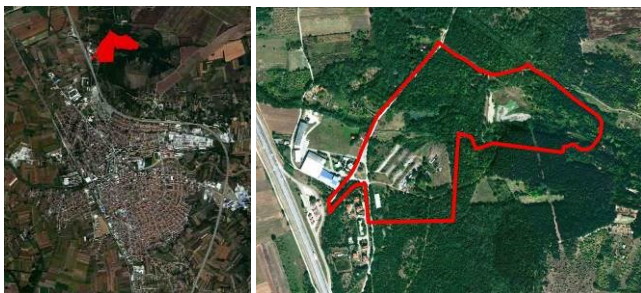
Slika 1. a) Položaj kompleksa „7. juli“ u odnosu na grad Paraćin b) Granice kompleksa „7. juli“.

Kompleks „7 Juli“ je lociran na Karađorđevom brdu u Paraćinu severno od auto-puta Beograd-Niš. Naselje Karađorđevo brdo sa centrom naselja i ostalim njegovim delovima ostvaruje vezu preko četiri podvožnjaka od kojih je jedan u neposrednoj blizini kompleksa „7 Juli“. Kompleks je oivičen sa zapada auto-putem Beograd-Niš i kompleksom mešovitog poslovanja, sa severa i istoka šumskim zemljištem, a na jugu kompleksom individualnog i vikend stanovanja. Obuhvat koji je bio predmet urbanističko-arhitektonske razrade čini stari sportsko-rekreativni kompleks sa terenima za male sportove, jezerom i zelenim površinama oko postojećih sadržaja (Slika 1).